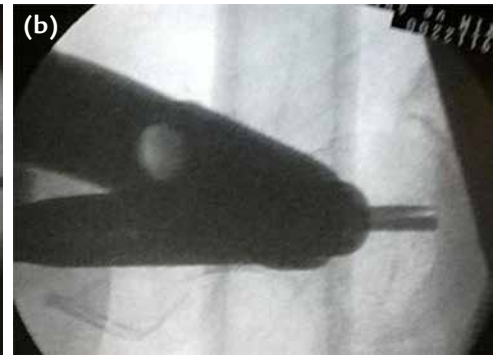
Şekil 6. a, b. Hizalama çubuğunun lateral skopi görüntüsünde femur başının anteversiyonu ile aynı ve tam ortada olduğu görülmektedir (a). Sistemin içinden femur başına yollanan vidaların üst kılavuzunun lateral skopi görüntüsünde femur başının tam ortasında olduğu görülmektedir (b).