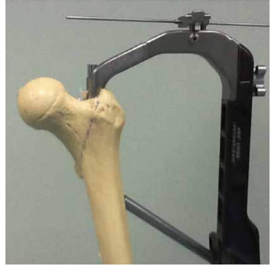
Şekil 3. Yapay kemik üzerine uygulanan çivi ve çakma setine tespitli aparat yandan görünüşü.