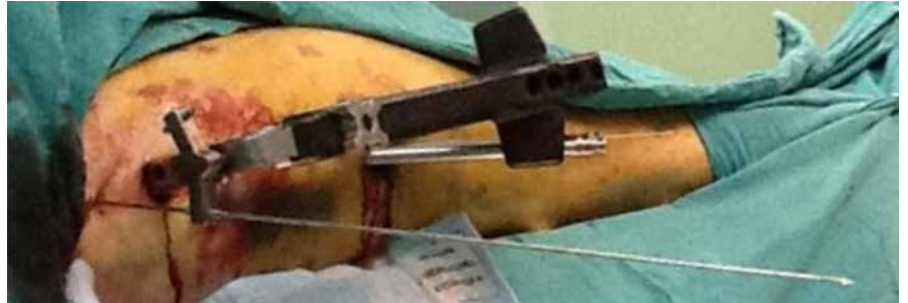
Şekil 5. Ameliyat sırasında hizalama çubuğunun aparatın içinden gönderilmesi.