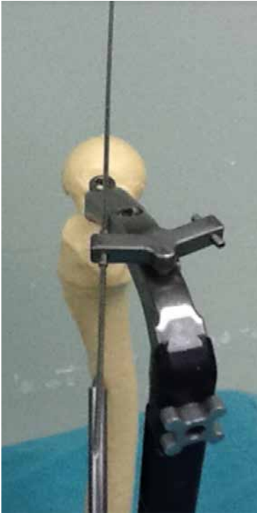
Şekil 4. Yapay kemik üzerine uygulanan çivi ve çakma setine tespitli aparat üst çaprazdan görünüşü.