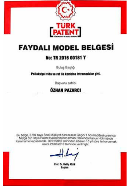
Şekil 3. Faydalı model belgesi.